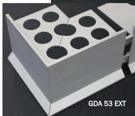
GDA 53 EXT