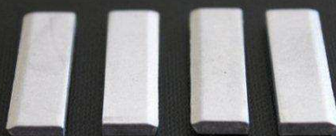
GDA 53 RAC