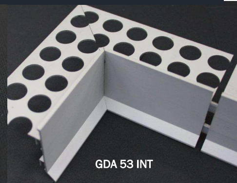
GDA 53 INT

Raccord externe - Fourni avec 4 pièces de jonction